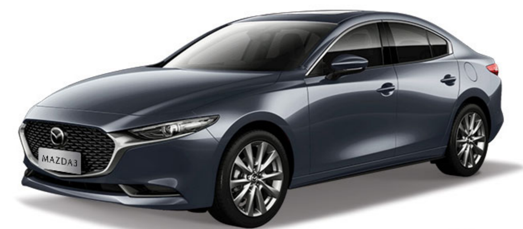
Dark Gray خاکستری تیره